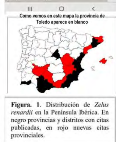
Figura. 1. Distribución de Zelus renardii en la Península Ibérica. En negro provincias y distritos con citas publicadas, en rojo nuevas citas provinciales.