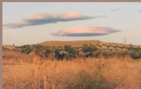
Paisaje al atardecer con "ovni" sobre los cerros cercanos al cerro Talagudo.