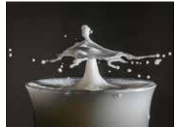
2º Premio modalidad libre