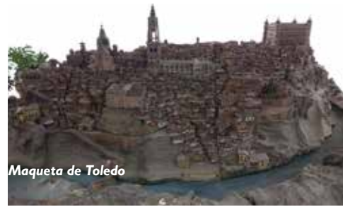
Maqueta de Toledo

Víctor llegó a la torre del homenaje y se quedó asombrado. Unos candelabros de seis brazos alumbraban la estancia creando sombras siniestras en las paredes de piedra. En el centro del cuarto había una cama con dosel y amplios cortinajes. Una puerta con un arco de medio punto daba acceso a una pasarela que recorría toda la torre. Se asomó y se quedó apoyado en el muro contemplando la ciudad, ese lugar extraordinario que parecía un portal de Belén iluminado, con su río, sus casitas y su castillo. Allí estaba cuando su hermano se colocó a su lado.