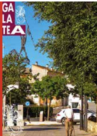
Confluencia del Paseo de los Álamos con Plaza Mayor