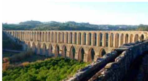
Acueducto de Tomar (Portugal).

Nuestro amigo Miguel se introduce de inmediato en el mundillo literario de la Corte, en busca de editoriales y en contacto con los poetas fraternos no vistos algunos desde su partida, otros desde los bellos momentos renacientes de la Italia pre y post lepanтина.