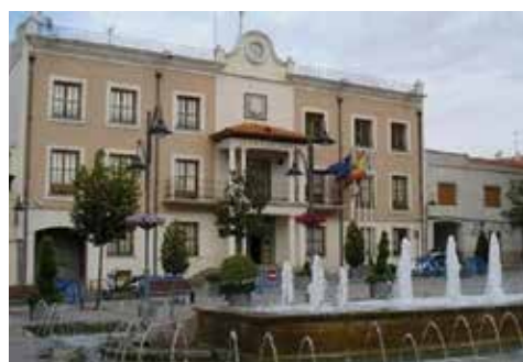
Tomelloso, plaza y edificio del Ayuntamiento.