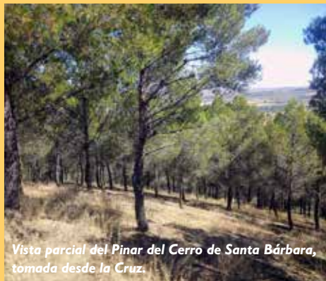
Vista parcial del Pinar del Cerro de Santa Bárbara, tomada desde la Cruz.