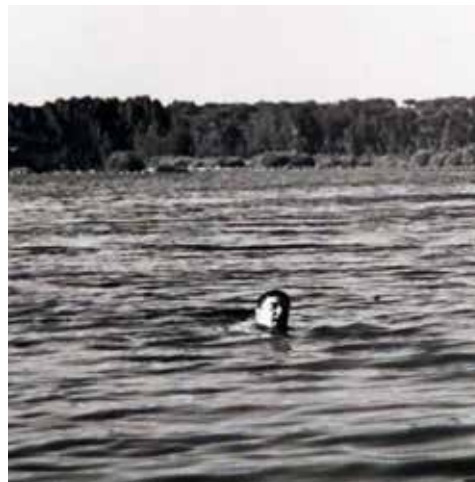
“El río Tormes a su paso por el término municipal de La Horcajada”

¡Cuántos viajes buscando al especialista que le devolviera la vista! ¡Cuánto tiempo dedicado al sistema Braille para que Antonio pu-