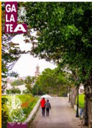
Paseo primaveral después de orar por los seres queridos en el cementerio.