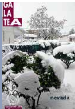
Nevada de los días 7 y 8 de enero. Parodiando la canción infantil, el patio de mi casa lleno de nieve como los demás.