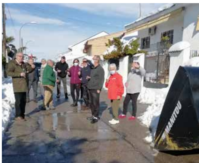
Vecinos de la calle Madrid después de haber limpiado la calle de nieve.