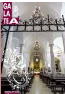
Interior de la iglesia parroquial de Esquivias. En ella se celebró el matrimonio de Miguel de Cervantes Saavedra y Catalina de Salazar y Palacios el día 12 de diciembre de 1584

Asociación Cultural Santiago Apóstol de Quintanar de la Orden Hermanada con la S. Cervantina de Esquivias desde 2005