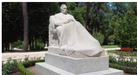
Monumento de Victorio Macho a Galdós en El Retiro. Madrid

También es acreedor de un Centenario digno, acorde con su persona y con su obra. Pero la celebración no ha brillado como debía, supongo que a ello ha contribuido la pandemia. La repercusión de los actos ha sido escasa, por no decir nula; y sólo en diciembre, cuando termina el Centenario, hay alguna resonancia en la prensa diaria. La aportación de Galatea es pequeña, pero insistente, hemos tenido presente a Galdós en cada número de este 2020. Tal vez, podremos contribuir a que surja algún lector nuevo que entienda como otros, viejos, que Galdós abre “una ventana a través de la cual podemos ver la vida cotidiana de la sociedad española”. Si las obras facilitan el conocimiento de la época, su vida explica, en gran medida, la razón de las mismas. La visión de los hechos sociales y políticos del siglo XIX le compromete e impele a participar, a no ser mero espectador.