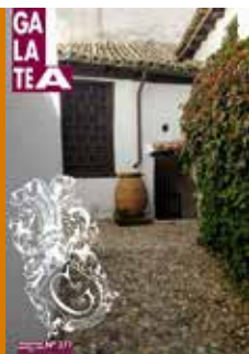
Rincón pintoresco de la Casa-museo de Cervantes en el que se aprecian las entradas a la cueva y a la bodega, el palomar y la recogida de agua de lluvia.

Asociación Cultural Santiago Apóstol de Quintanar de la Orden Hermanada con la S. Cervantina de Esquivias desde 2005