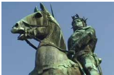
Detalle de la estatua ecuestre de Bertrand Du Guesclin (1314-1380) en la plaza de Dinan, bonita ciudad francesa en Bretaña.

Para los tiempos que vivimos hay dos formas de codicia que se practican sin recato: la codicia de riquezas y la codicia de poder. Ambas son muy viejas y, nuevamente, la Biblia nos ilustra sobre ellas. En el Libro de Josué (7, 1-24), Acán es lapidado por apropiarse de objetos dados al anatema (exvotos en los muros de los templos) y esconderlos en su tienda movido por la codicia. En 1 Reyes (21, 1-19) se refiere la historia de “La viña de Nabot”. Al negarse Nabot a vender su viña al rey Ajab, Jezabel su esposa logra que se acuse falsamente a Nabot que fue lapidado y Ajab se apoderó de la viña. Pero la codicia es